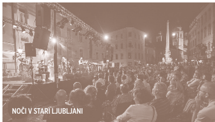
NOČI V STARI LJUBLJANI

28 LJUBLJANA STARO MESTNO JEDRO - RAZLIČNE LOKACIJE / OLD TOWN - VARIOUS LOCATIONS